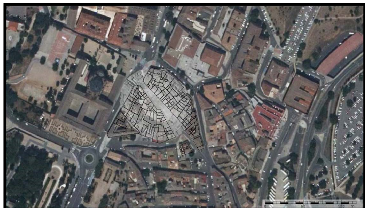
Situación del anfiteatro en el barrio de las Covachuelas