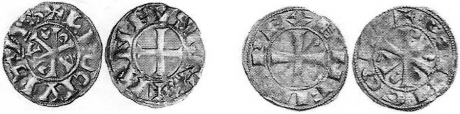
Dineros de León (1º Ref. A.C.J.Cayón nº 920) y Santiago de Compostela (2º A.C.J.Cayón nº 925)

Llaman la atención algunas monedas que aparecen con dos taladros, costumbre que ya se venía realizando desde el periodo emiral y califal, que continúa durante los reinos de Taifa y que también vemos ahora en las monedas de Alfonso VI, costumbre atribuida a una forma de