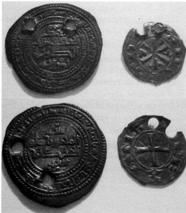
1º Dirham de Almamún de ceca Toledo del año 465 H. (1072/3 d.C.) Ref. V. IIII

Llaman la atención algunas monedas que aparecen con dos taladros, costumbre que ya se venía realizando desde el periodo emiral y califal, que continúa durante los reinos de Taifa y que también vemos ahora en las monedas de Alfonso VI, costumbre atribuida a una forma de