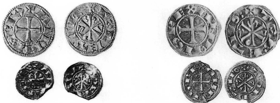
Dineros y óbolos: 1° TOLETVM / 2° TOLETVO

Finalmente hay otra serie similar a las anterior en la cual se mantienen las características de las dos áreas, excepto que en el anverso de algunas monedas aparece un punto en el área superior izquierda entre los brazos de la cruz, y en el reverso la inscripción de la orla indica +TOLETVO . La serie con +TOLETVO , son las más comunes y se estima que fueron labradas entre los años 1100 y 1109 al final del reinado de Alfonso VI.