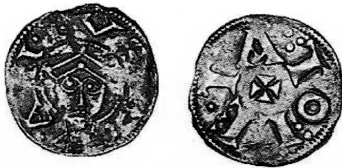
Ref. N o 20 Aureo 5-3-2003 11,14 grs.