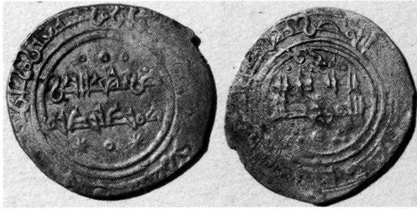
Nº 1 Ref. Vives 1131 y Prieto 443 3 Fotos R. Frochoso