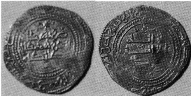
Nº 2 Vives 1132 y Prieto 442

En el mes de Yūmādā I del año ocho y setenta y cuatrocientas