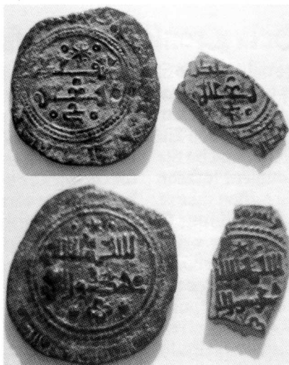
Dirham y fracción de dirham de cobre. Al-Qadir, V.1121, Medina Cuenca año 474 H.