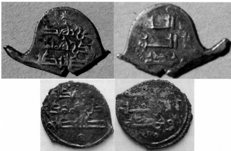
Fracciones de dirham serie N° 2

que hacían los musulmanes durante las Taifas y que ya vimos en las fotos de los dirhames y sus fracciones del rey al-Qadir 4 .