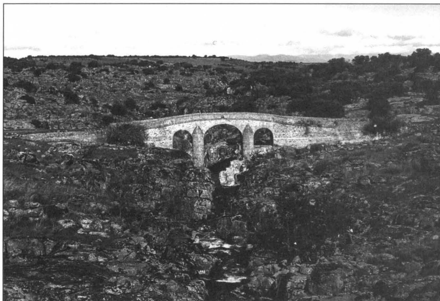
Santa Ana de Pusa: Puente Viejo, aludido en el texto

En la segunda hoja, en la parte inferior del mapa aparecen dos dibujos a plumilla, de gran perfección; el primero se refiere al supuesto caserío de Santa Ana de Pusa, con la iglesia, su torre y ocho casas. El segundo figura el supuesto caserío de San Martín de Pusa con la iglesia, torre y quince casas. En la parte oeste se localiza el supuesto caserío de San Bartolomé (de las Abiertas) con la iglesia, torre y diez casas.