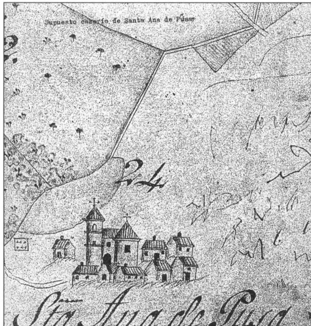
Supuesto caserío de Santa Ana de Pusa