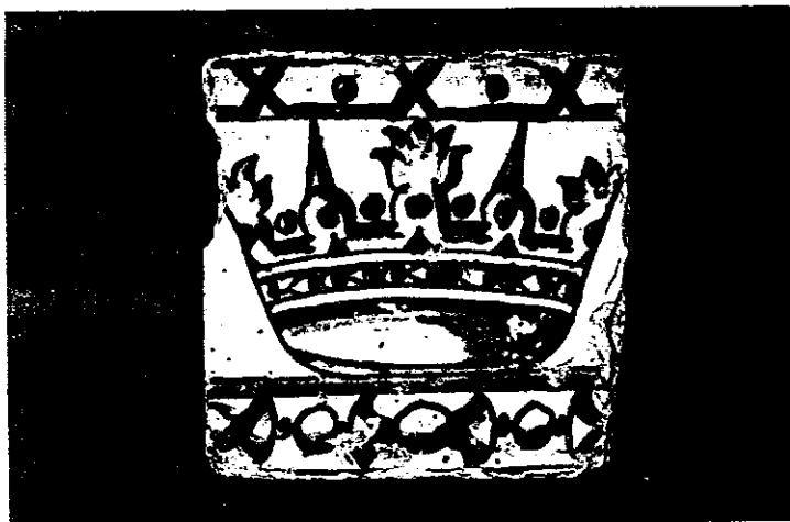
Azulejo de crestería (cenefa) pintado. Fines del siglo XVI. Juan de Vera menciona ... "azulejos de coronas, grandes..." hechos para El Escorial, pero no se ha hallado ningún azulejo de este tipo en el Monasterio. Tal vez llevaban un diseño parecido a éste. Medidas: 140 mm. x 140 mm., y 15 mm. de grueso.