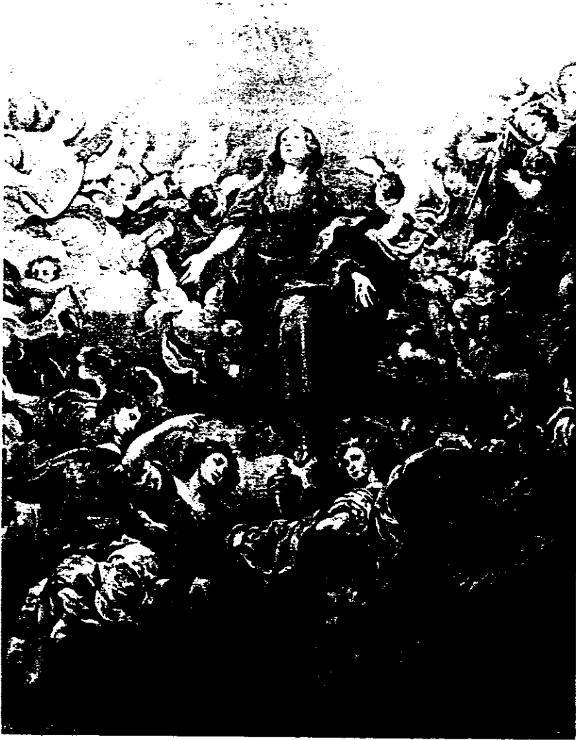
Francisco Rizi: Sta. María Magdalena, Palencia, colección particular. El lienzo de Burguillos reproducía este mismo tema pero fechado un año después.