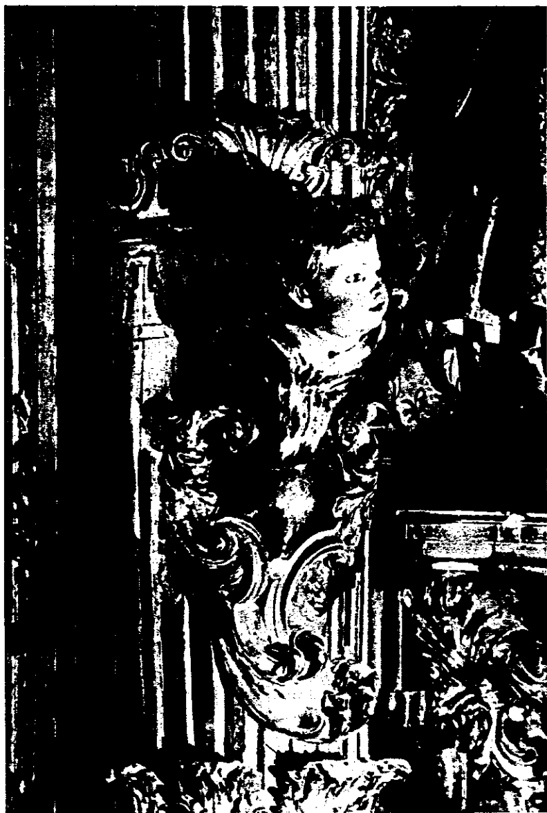
Monasterio Carmelitas Descalzas. Detalle retablo mayor.