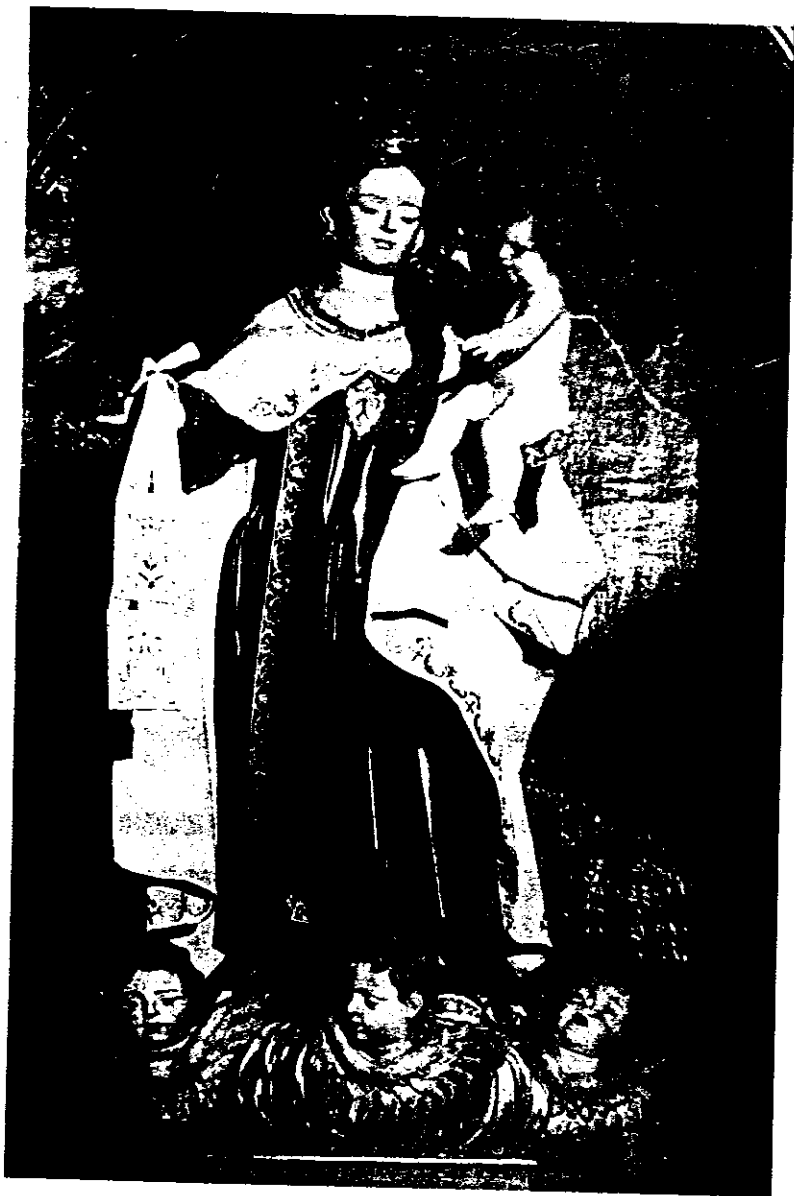
Carmelitas (Toledo). Virgen del Carmen.