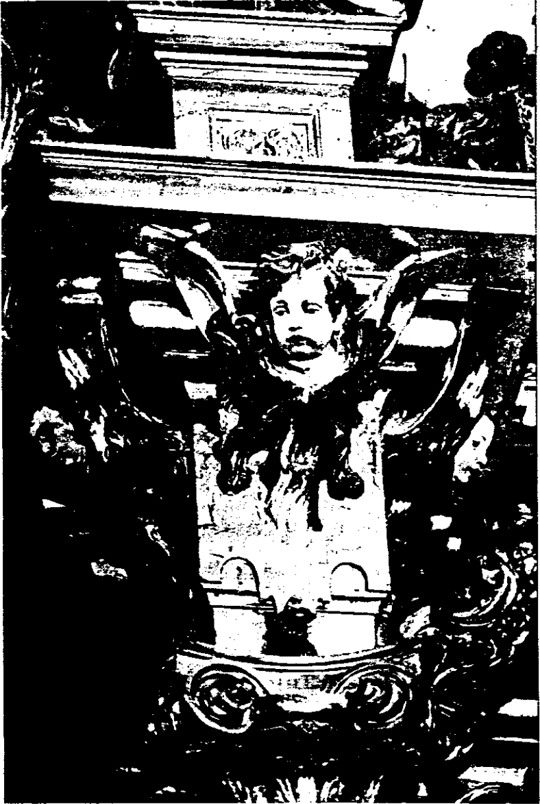
Monasterio Carmelitas Descalzas. Detalle retablo mayor.