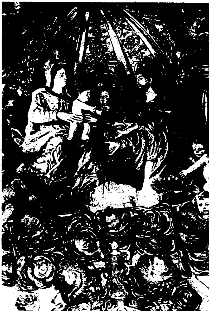
Monasterio Carmelitas Descalzas. Detalle retablo mayor.