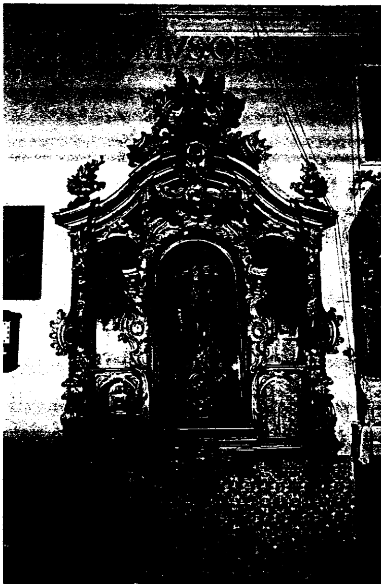
Monasterio de San Clemente. Retablo de la Inmaculada en el coro de las religiosas.