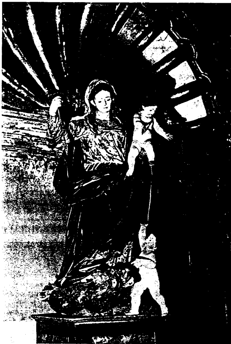
Iglesia de la Compañía (Toledo). Virgen del Socorro.