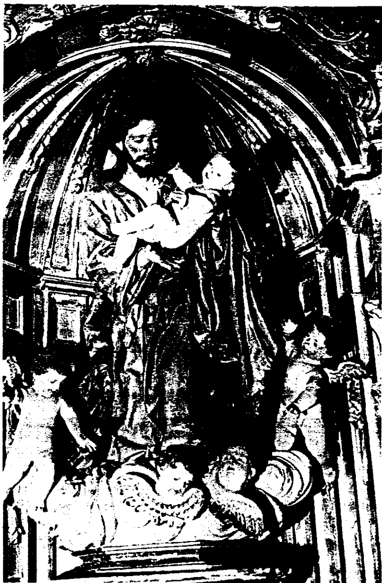
Iglesia de San Ildefonso -Jesuitas- (Toledo). San José.