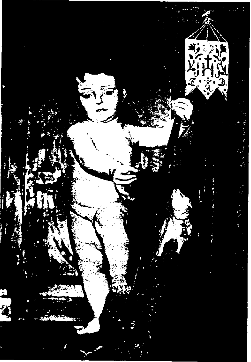
Monasterio de San Antonio (Toledo). San Juanito.