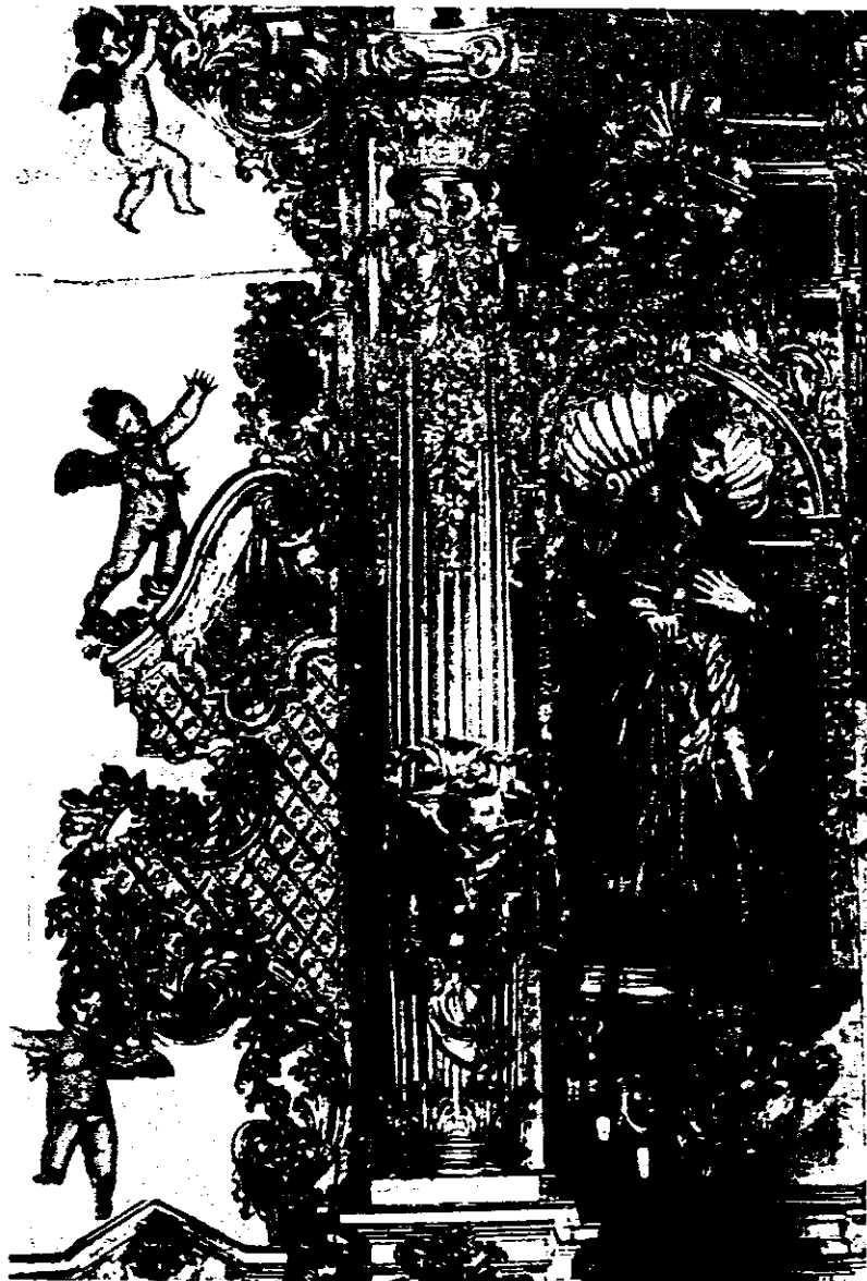
Monasterio Carmelitas Descalzas. Detalle retablo mayor.