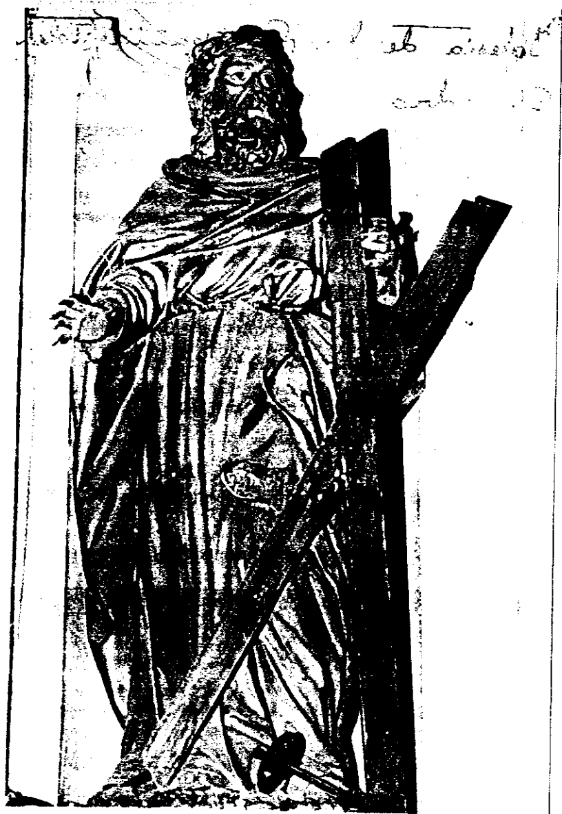
Iglesia de la Compañía (Toledo). San Andrés.