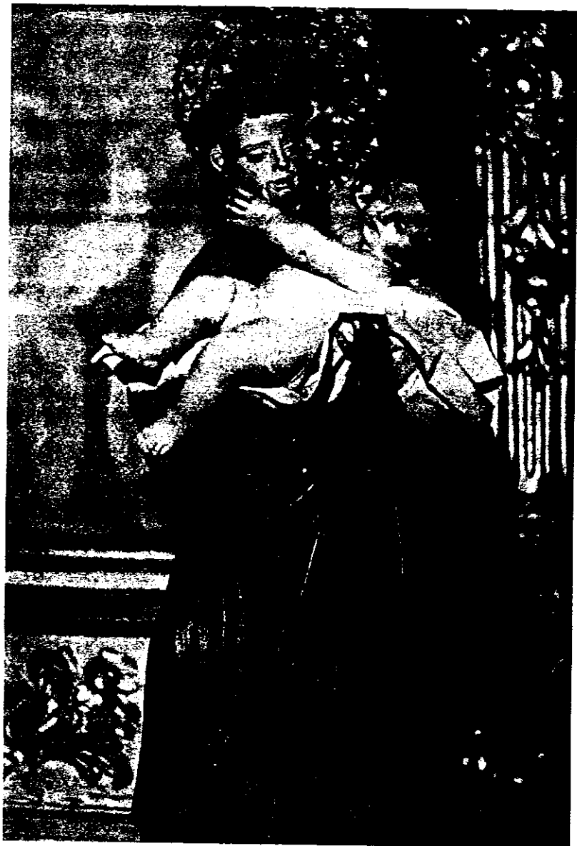
Parroquia de Santo Tomé (Toledo). San Antonio de Padua.