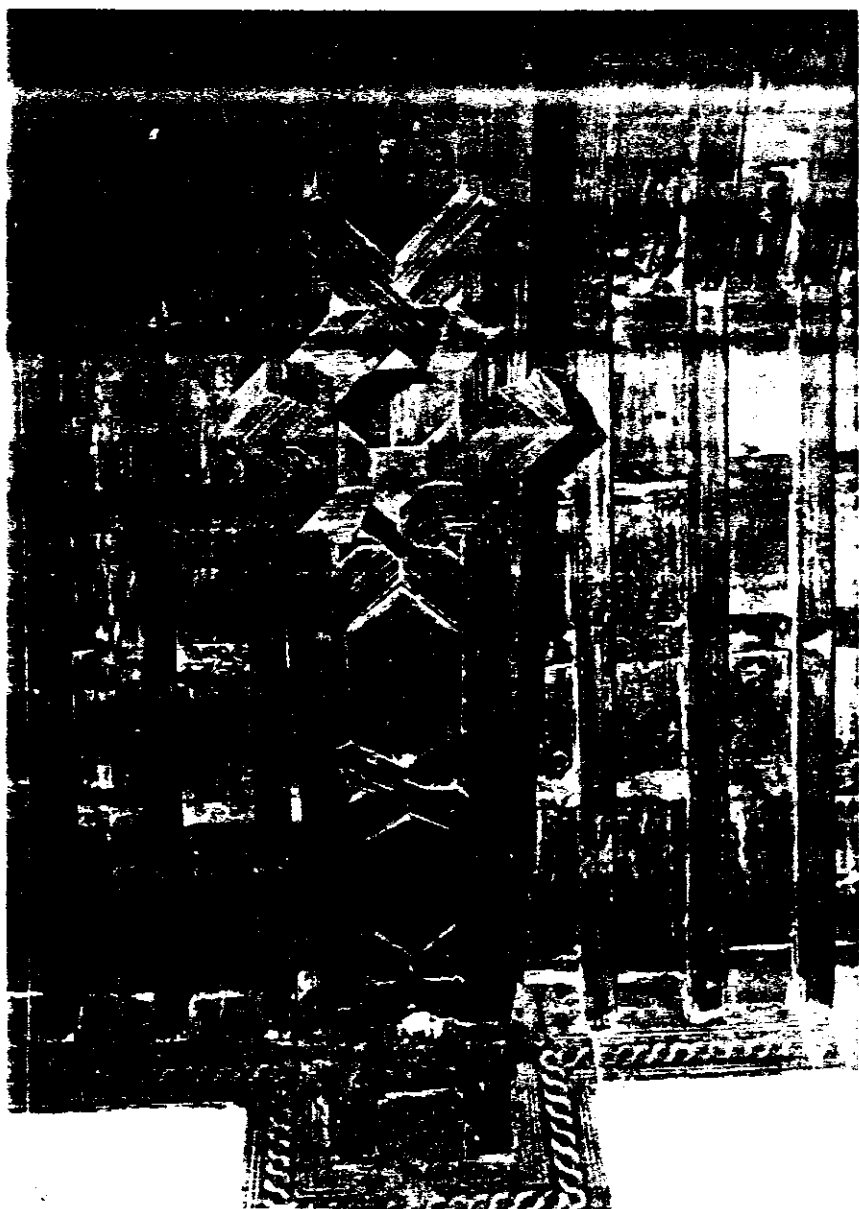
Sala de Cabildos de la Santa Caridad (Santa Justa). Artesonado