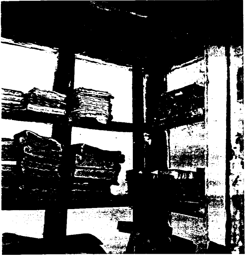
Armario - archivo