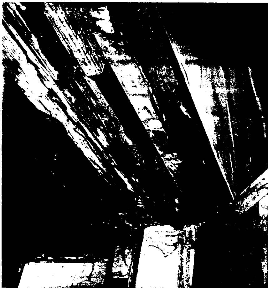
Techo del armario - archivo