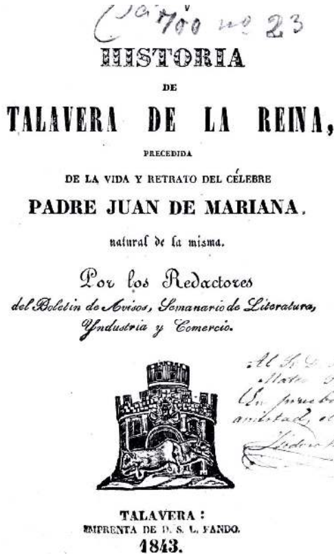
Fig. 1: Historia de Talavera de la Reina , Talavera, López Fando, 1843 (Biblioteca Nacional de España, VC/700/23).

laboración con sus hijos 8 , y falleció a una edad avanzada, después de haber ejercido el oficio de impresor durante aproximadamente medio siglo 9 .