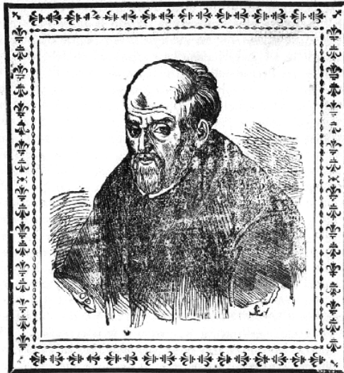
Fig. 2: Historia de Talavera de la Reina , Talavera, López Fando, 1843, p. 5 (Biblioteca Nacional de España, VC/700/23).

Hemos de subrayar que, pese a haber cesado su actividad impresora en Talavera relativamente pronto, don Severiano mantuvo aún después de 1848 un vínculo profesional -y seguramente también personal- con la ciudad, para la que continuó imprimiendo algún trabajo. Por ejemplo, de sus prensas salió un Sermón pronunciado por D. G. J. L. H. M. en el magnífico santuario de N. S. del Prado, que se venera como patrona en Talavera de la Reina (Toledo, 1849) en cuya portada encontramos un grabado del escudo talabricense, el mismo que había utilizado pocos años antes en un impreso del que hablaremos a continuación.