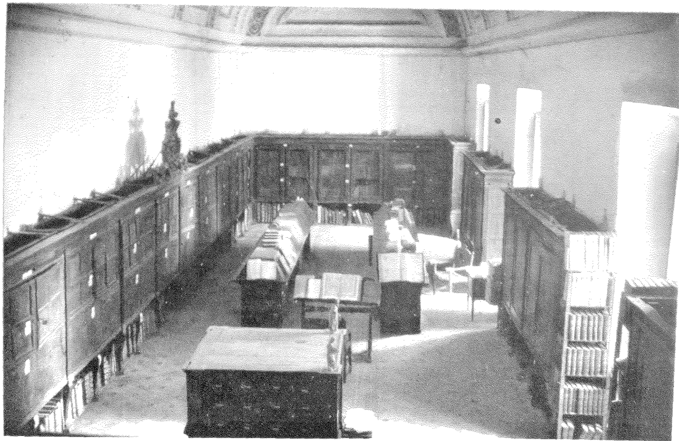
Vista general de la Biblioteca Capitular