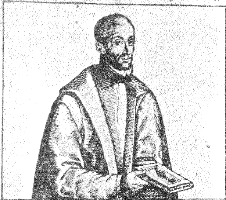
Retrattillo del licenciado Ferrn de Alencz colgial del Rey en oficio deor. en la Real cthaga de Alcal de Henary, al retrato de su hermano el licenciado Ferrn autor desta obra a la cthaga de Toledo, y en las de Espaa.

1 Pudo el arte con primer retratar vuestra figura: mas del alma la pintura pide otra mano, y pintor.