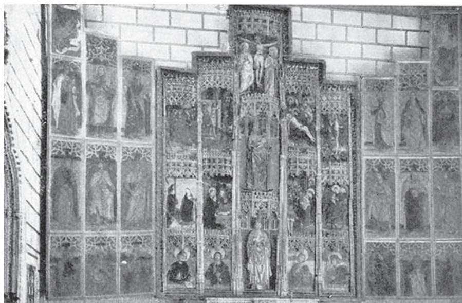
7. Retablo de la capilla de Santa Catalina, verdaderamente espléndida obra de arte, en una imagen anterior a la última guerra civil.