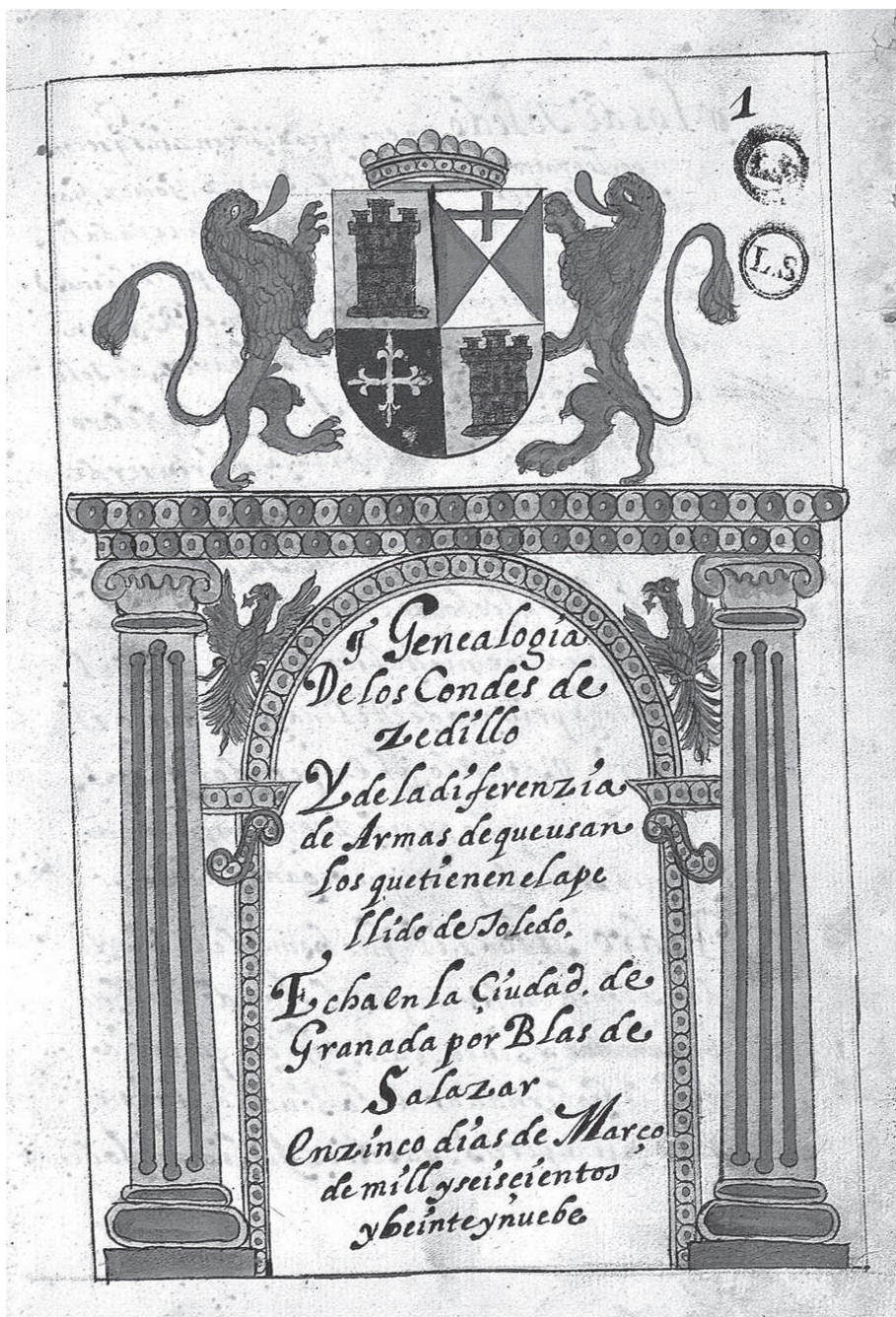
12. Portada iluminada de la obra dedicada a la genealogía de los Condes de Cedillo por el linajista granadino Blas de Salazar, fechada en 1629 (Real Academia de la Historia, colección Salazar y Castro, ms. B-5).