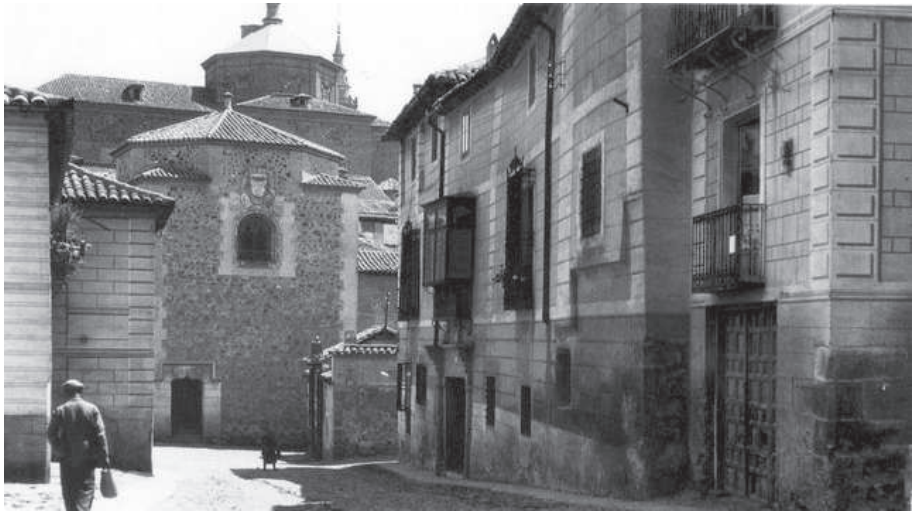
5. Imagen antigua de la fachada de la capilla de Santa Catalina, fundada por el secretario Fernán d'Álvarez de Toledo y su esposa doña Aldonza Illán de Alcaraz hacia 1490 y ricamente dotada.