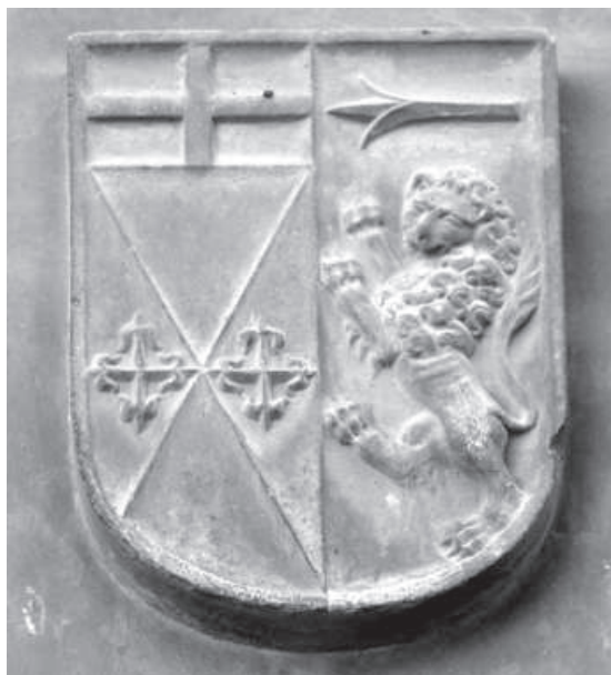
6. Escudo de los Condes de Cedillo (partido de Ajofrín-Bocanegra y Ponce de León), en la portada de la capilla de Santa Catalina, aneja a la parroquial de San Salvador. Es curioso que estos Toledo prefiriesen las armerías de sus antepasados los Ajofrín, cuarteladas con las de los Bocanegra, al castillo de su varonía.