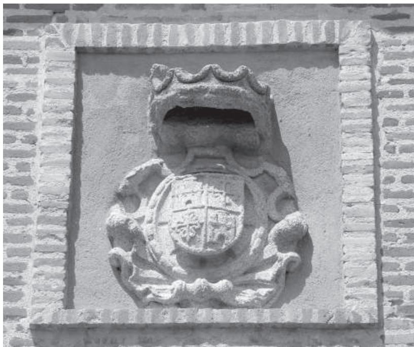
10. Escudo de armas de los Condes de Cedillo (Toledo y Ajofrín), en la fachada de sus casas principales de la villa de Cedillo.