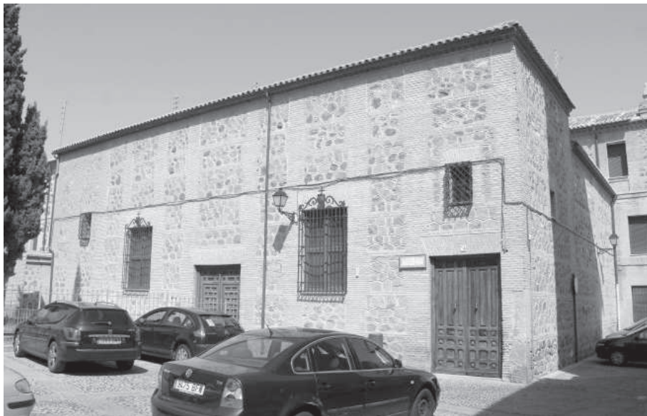
8. Vista sobre las casas en que habitaron los Señores y Condes de Cedillo durante los siglos XVI y XVII, en la plaza de San Andrés (hoy sede del Seminario Menor de Santo Tomás de Villanueva).