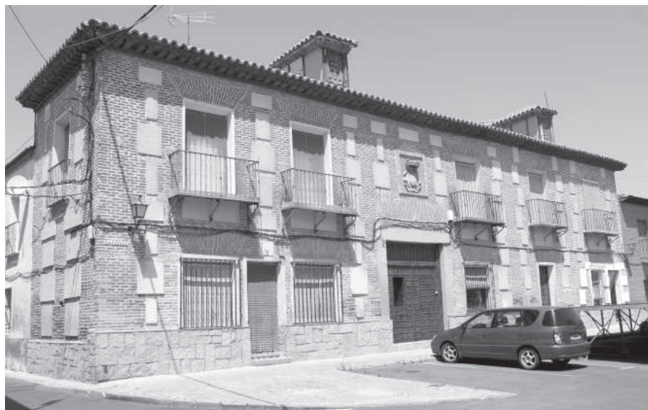
9. Fachada de las casas principales de los Condes de Cedillo en la plaza mayor de la villa de Cedillo.