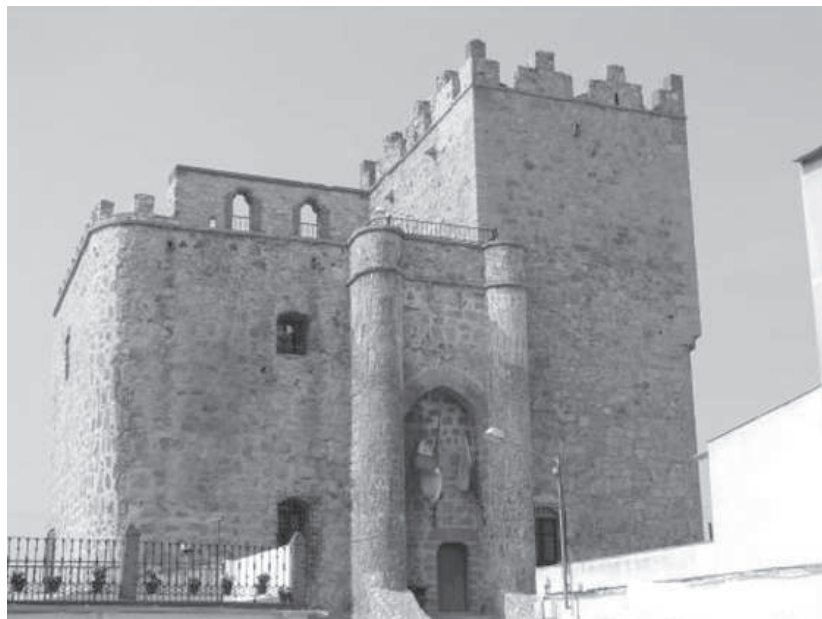
11. El castillo de Manzanque, que perteneció a los Condes de Cedillo.