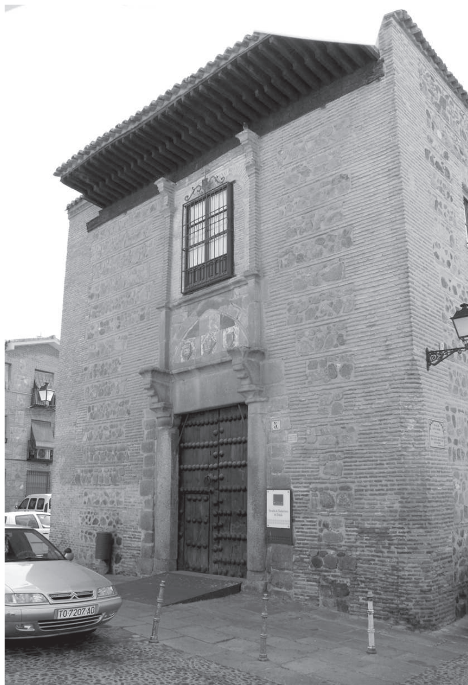
3. Portada de las casas que fueron del maestrescuela don Francisco Álvarez Zapata (+1523), fundador en 1485 del Colegio de Santa Catalina, convertido en universidad en 1520, y una de las grandes instituciones académicas toledanas.