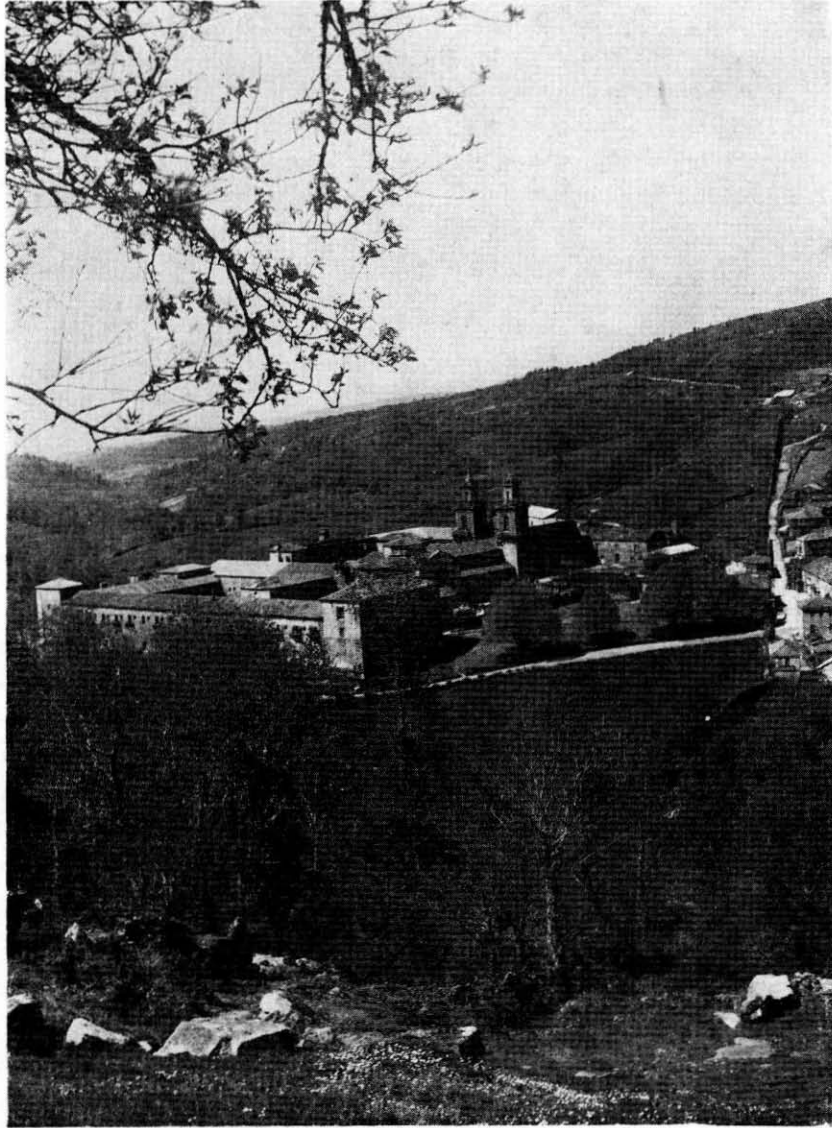
Monasterio de Osera.—Vista desde el Noreste