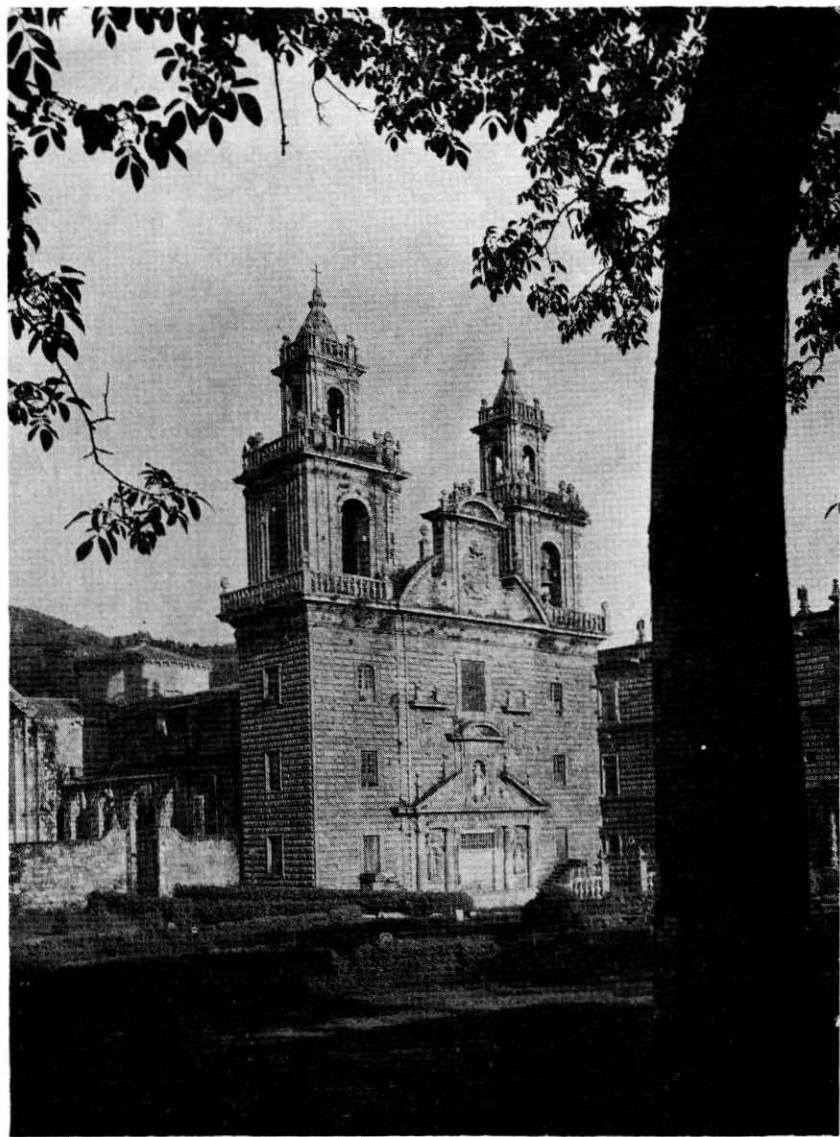
Monasterio de Osera.—Fachada de la iglesia