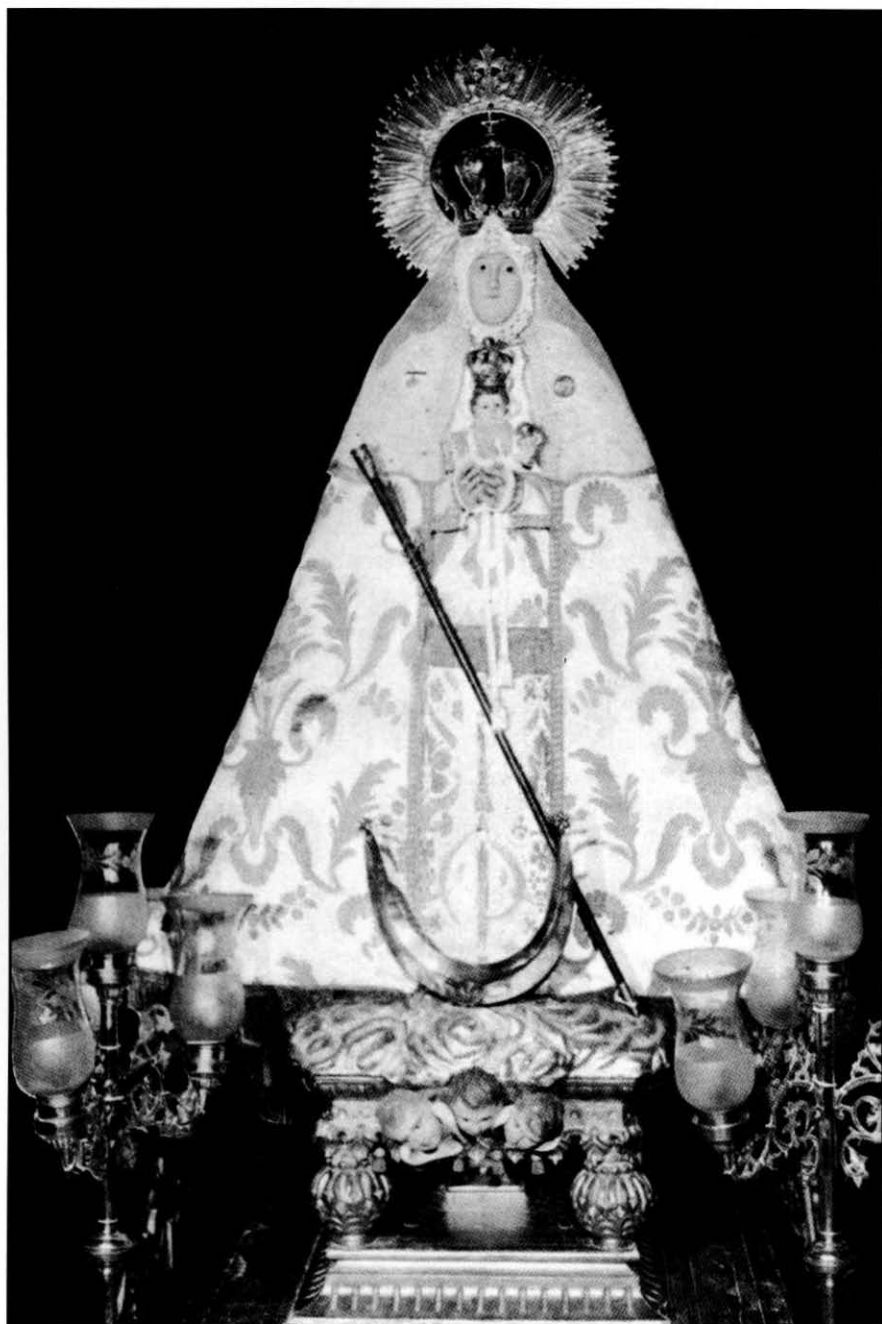
Nuestra Señora Santísima Virgen de la Muela, patrona de Corral de Almaguer (Toledo).