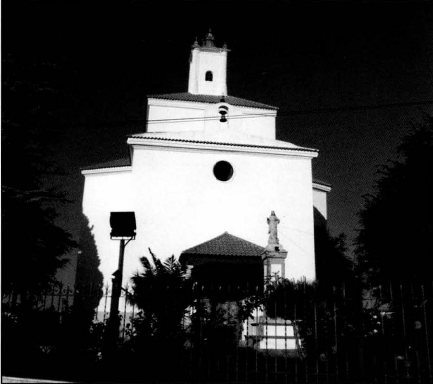
Dosbarrios. Ermita de la Virgen del Rosario.

–Ermitas de San Bartolomé, Santiago, Magdalena, San Sebastián (se guarda por la pestilencia), Nuestra Señora de Gracia, Santa Ana, La Caridad. Dos humilladeros con crucifijos y un calvario.