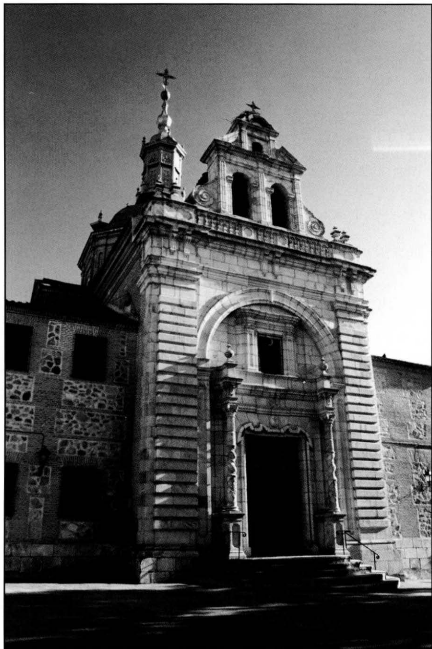
Consuegra. Ermita del Cristo de la Vera Cruz.