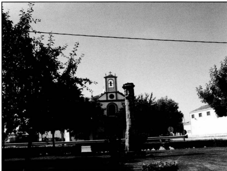
Quintanar de la Orden. Ermita de Santa Ana.