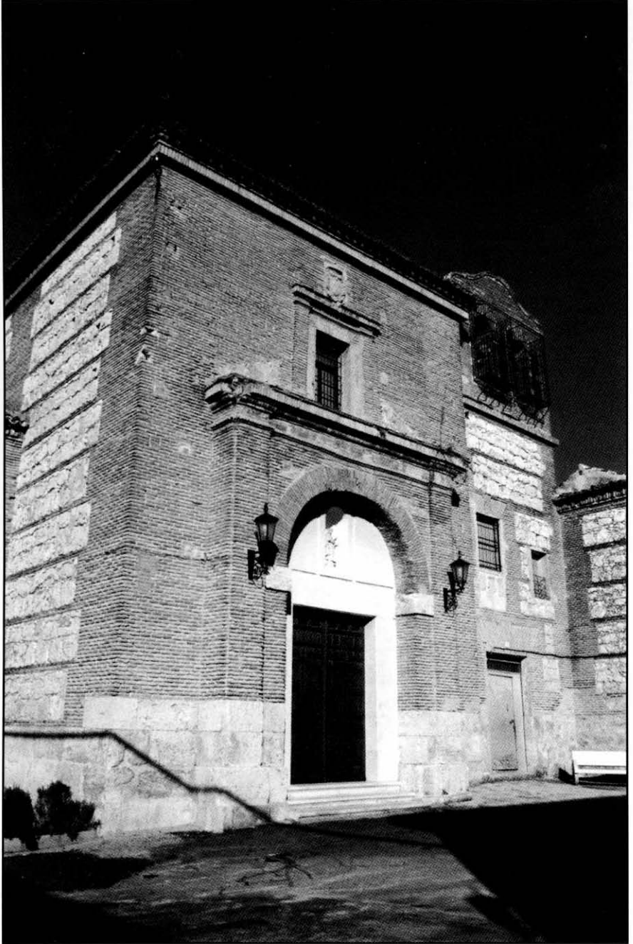
Ocaña. Convento de Santa Clara.