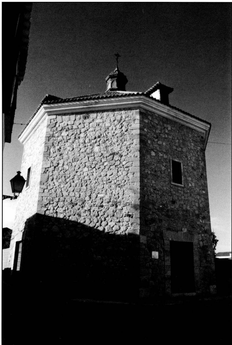
Tembleque. Ermita de la Vera Cruz.