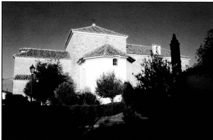
Tembleque. Ermita de la Purísima Concepción.