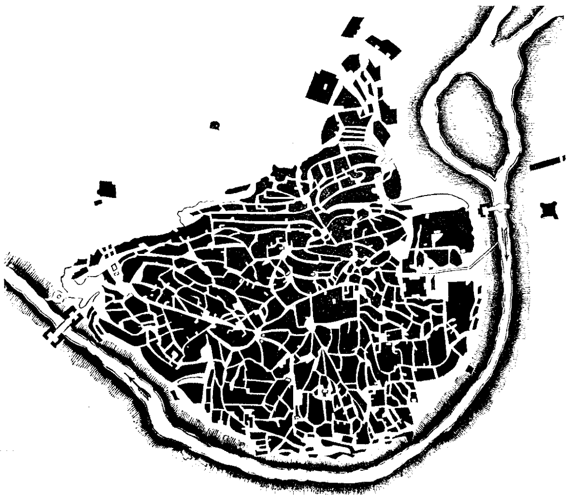
PLANO DE TOLEDO.