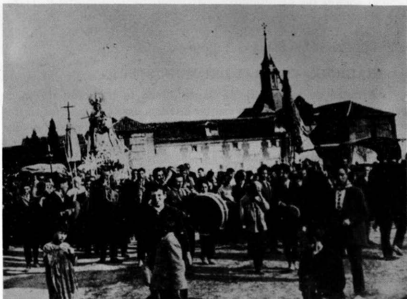
Fotografía tomada en las primeras décadas del siglo, de la romería de Nuestra Señora de la Cruz, en el convento de su nombre en Cubas, donde vivió y fue abadesa Sor Juana de la Cruz. Al fondo el primitivo edificio desaparecido en 1936

descubierto el Archipiélago. Enviadas por la Abadesa habían partido dos religiosas del convento de Cubas, con otras dos del convento de Santa Isabel de Toledo, llevando como abadesa a la madre Jerónima de la Asunción. Moría, pues, en Filipinas aquella religiosa; y en su enfermedad, todo su deseo era ver a la Madre Juana y así se lo pedía insistentemente al Señor, que se lo concedió. Ante sus gritos de “Hela, hela allí a mi bendita madre Juana de la Cruz que viene a visitarme y despedirme en mi última partida”, sus compañeras la creían delirar y la mandan callar. Ella insistía en que la había reconocido en el rostro y en el hábito, y sobre todo en el gran consuelo y alegría espiritual que en su alma había dejado.