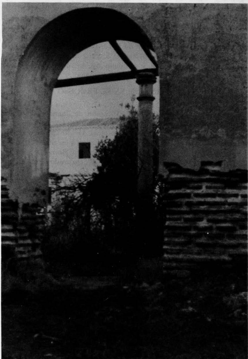
Entrada al viejo claustro