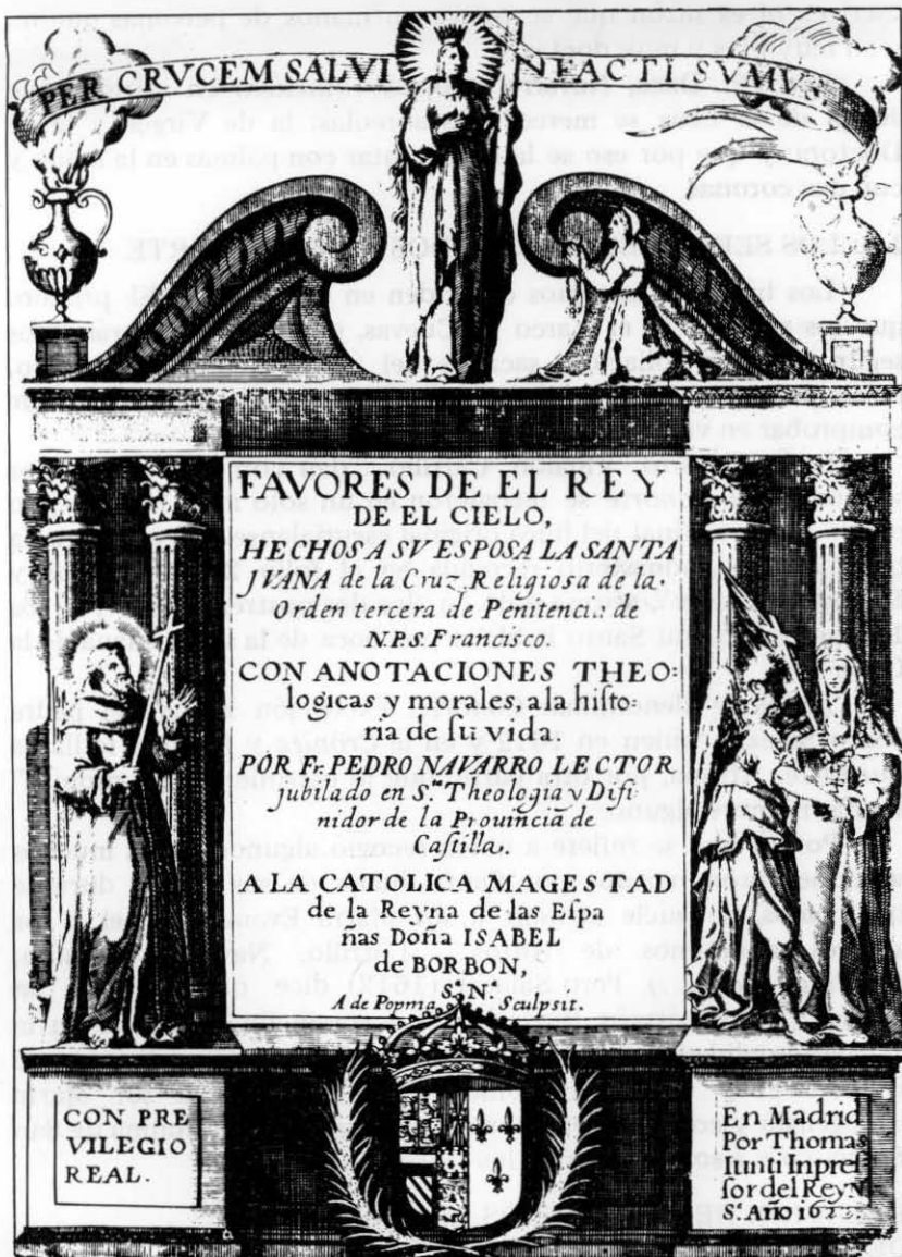
Primera página del libro impreso en 1622 que contiene una biografía y alguno de los escritos de la iluminista toledana Sor Juana de la Cruz