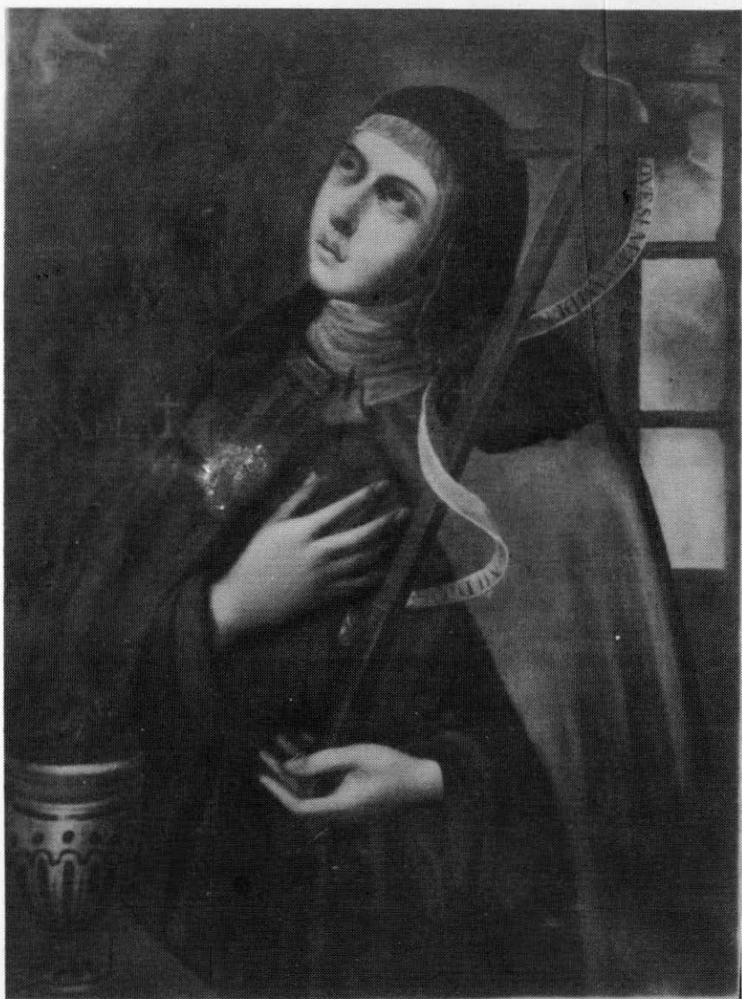
Retrato en lienzo de Sor Juana de la Cruz que se conserva en el convento de franciscanas de Carrión de los Condes (Palencia)