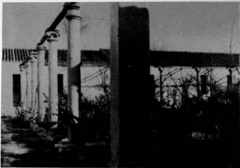
Restos del antiguo claustro del convento de Nuestra Señora de la Cruz en Cubas

La popularidad de Juana de la Cruz y su reconocida santidad, la inicial dramatización de su vida en su monasterio a pocos años de su subida al cielo, la docena de biógrafos que narraron su vida y obras y tres dramas versificados de otros tantos autores (Tirso de Molina, Quirós y Cañizares), muestran la popularidad de que gozó en vida y después de su muerte nuestra santa heroína en Cubas y en toda España.