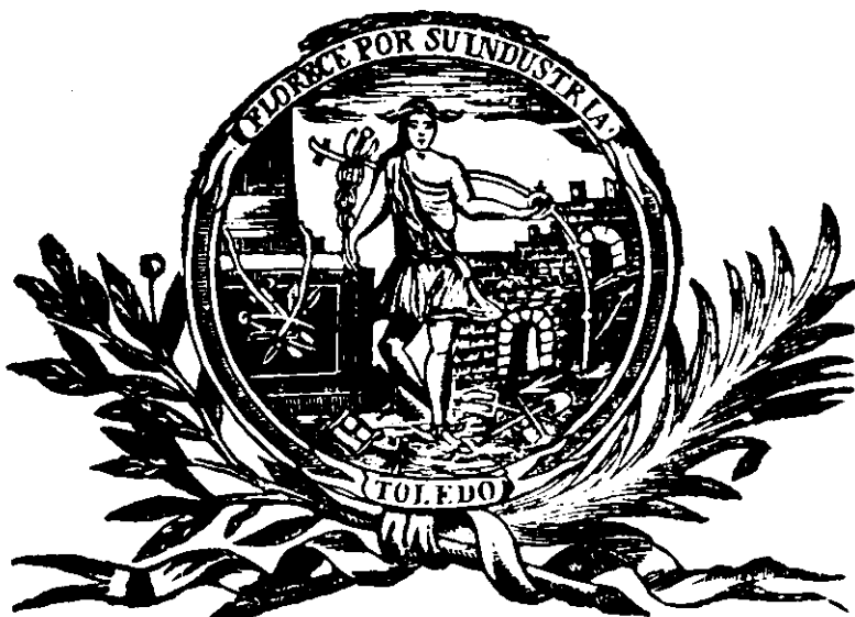
Emblema de la Sociedad Económica Toledana de Amigos del País.