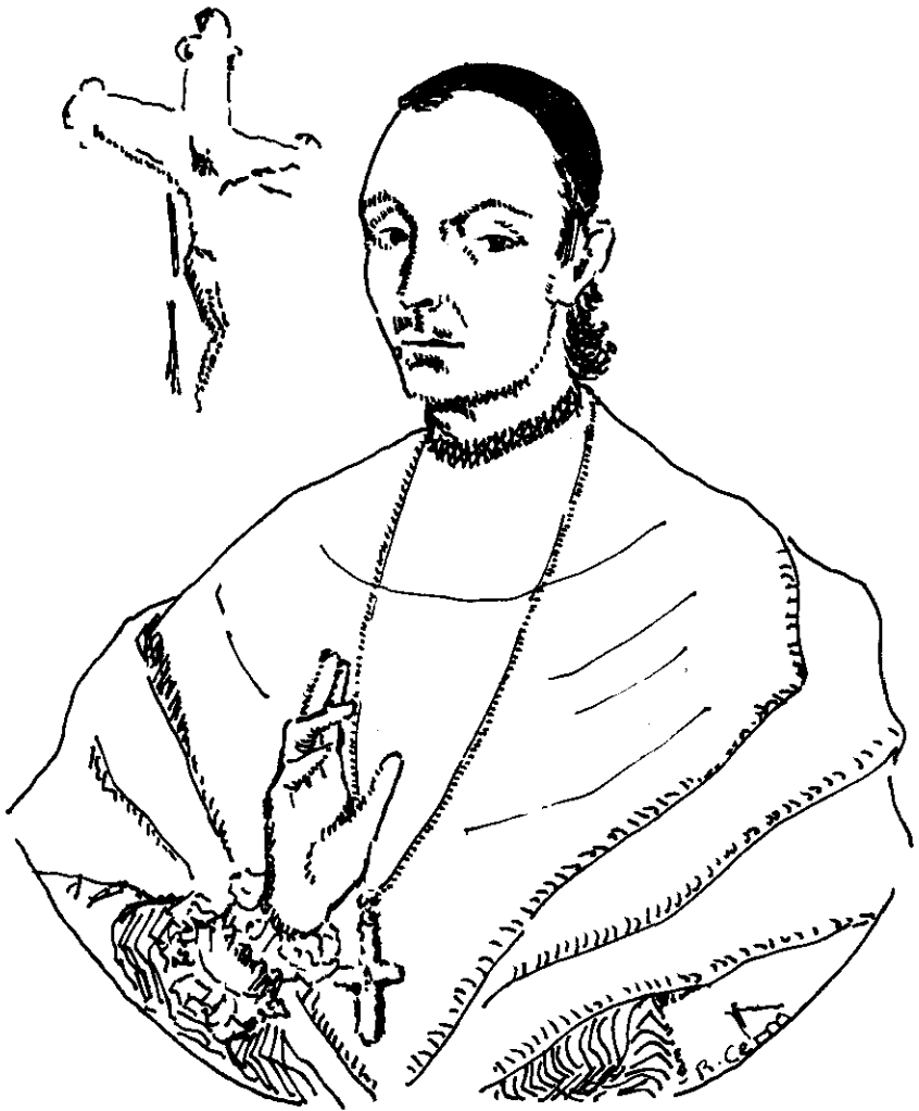
El Cardenal-Arzbispo D. Francisco-Antonio de Lorenzana.