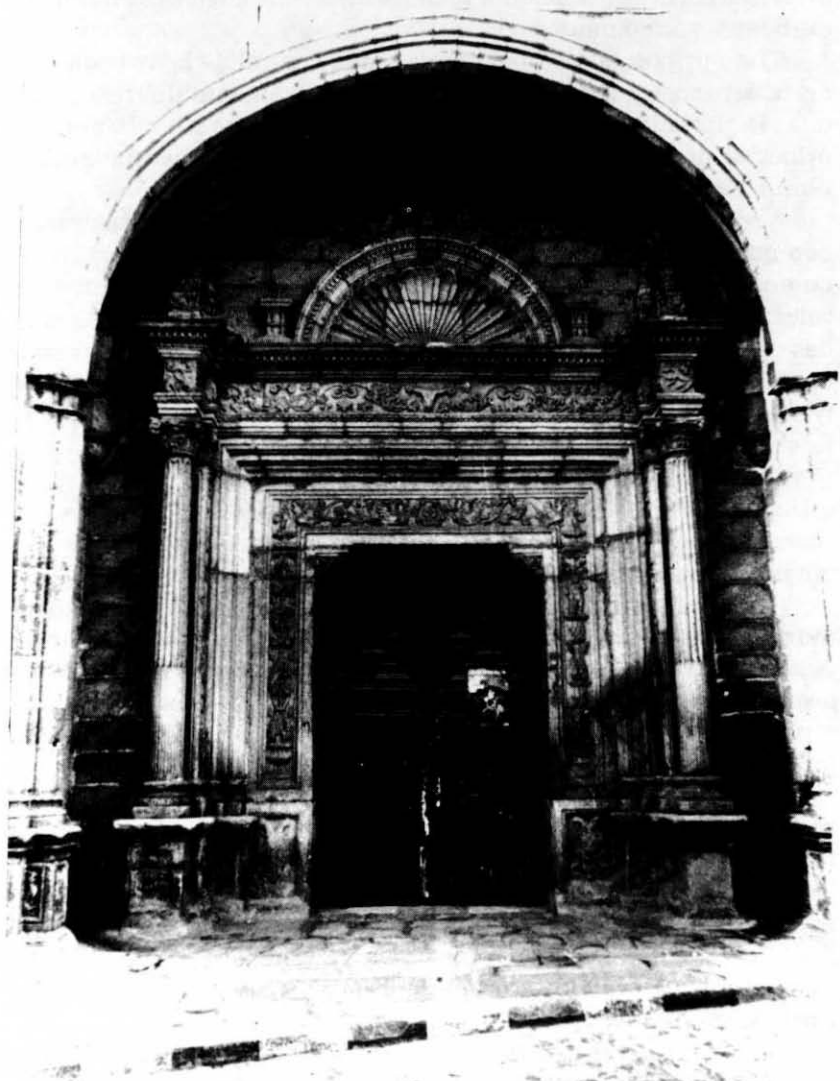
Fachada de la portada principal de la Iglesia