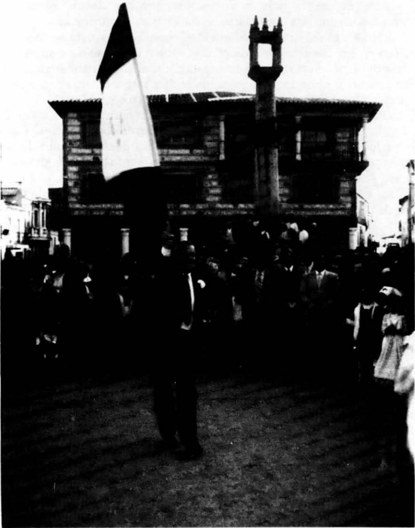
Momento del juego o baile de la Bandera de Animas, que consiste en voltear o airear la bandera alrededor del cuerpo del que la baila, de forma que la misma se envuelva en su mastil, y una vez conseguido hacerlo a la inversa, para que quede totalmente extendida al viento.