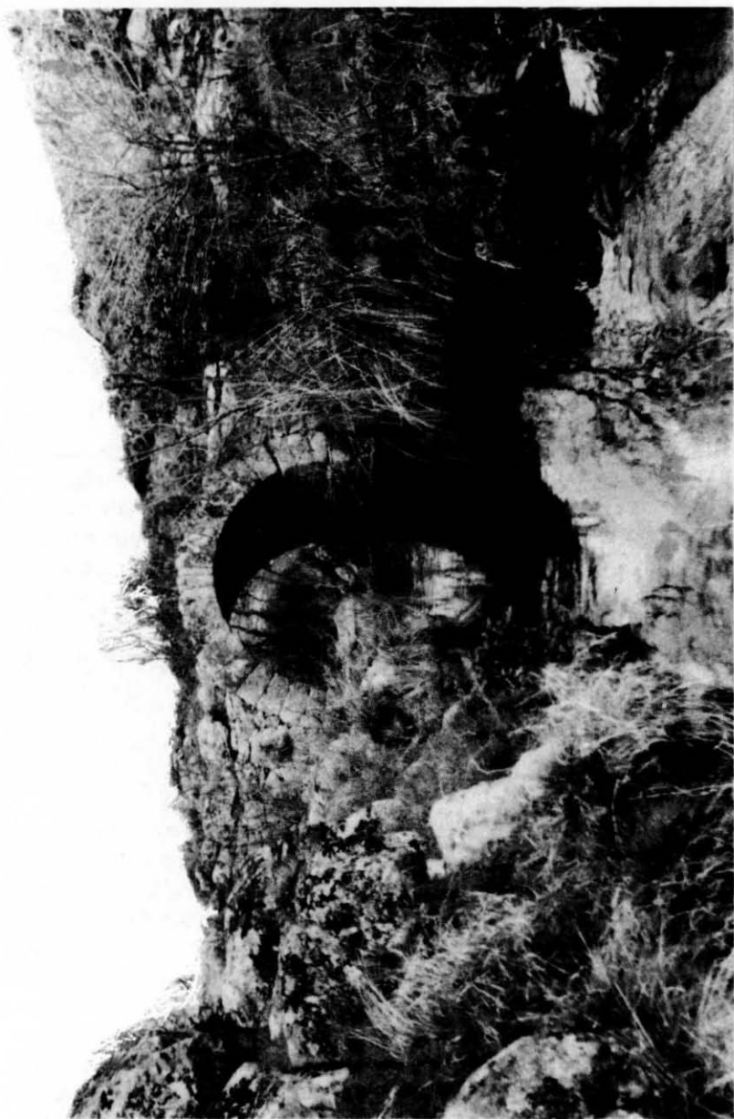
Puente de las Barguillas