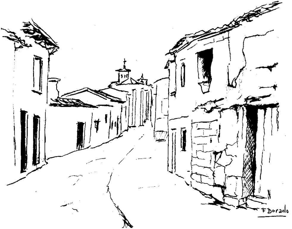
Una calle del pueblo