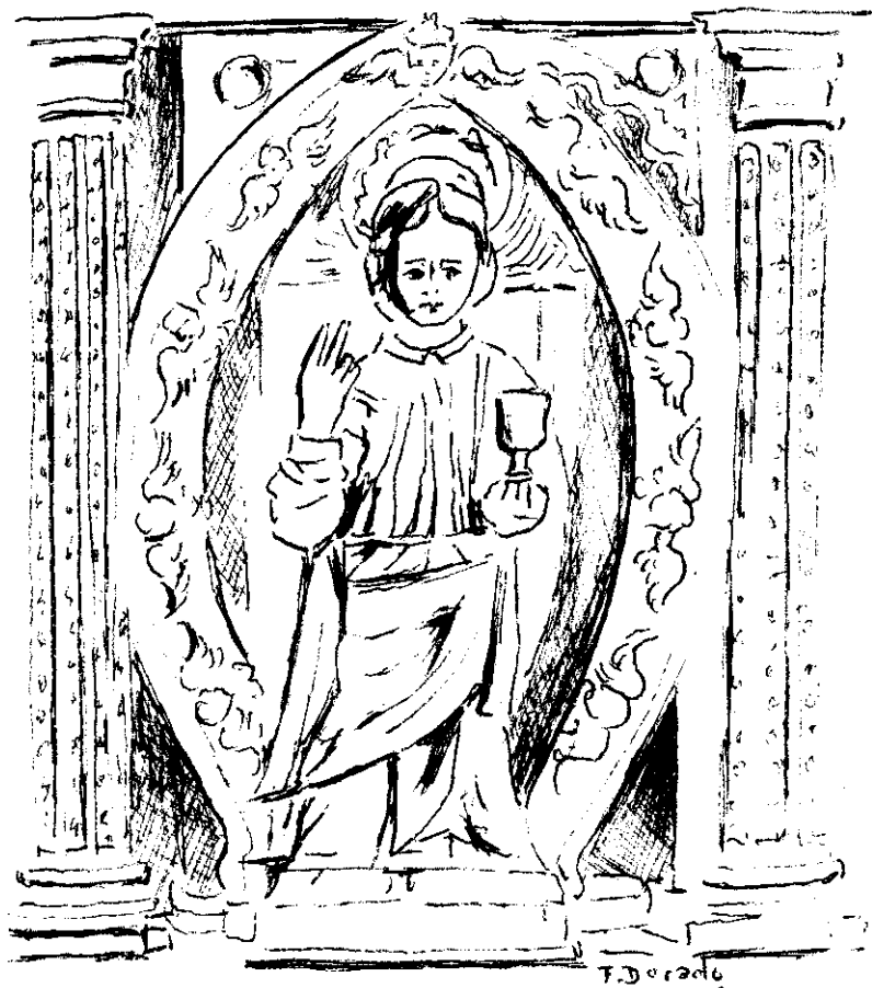
San Juan Evangelista