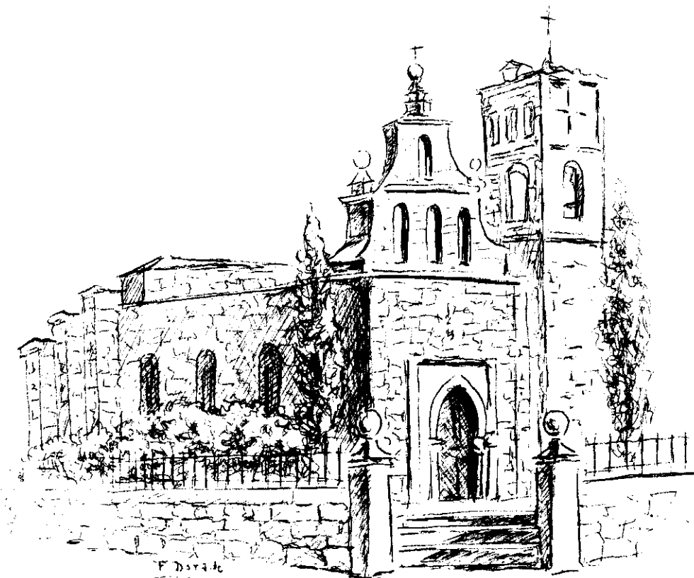
Vista general de la iglesia parroquial