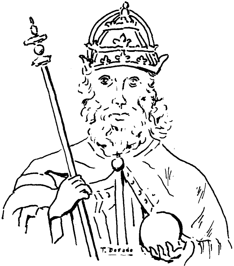
Alfonso XI (de una miniatura de la Biblioteca Nacional).