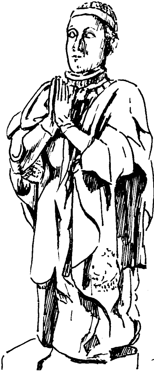
Estatua orante de Pedro I el Cruel (Museo Arqueológico Nacional).