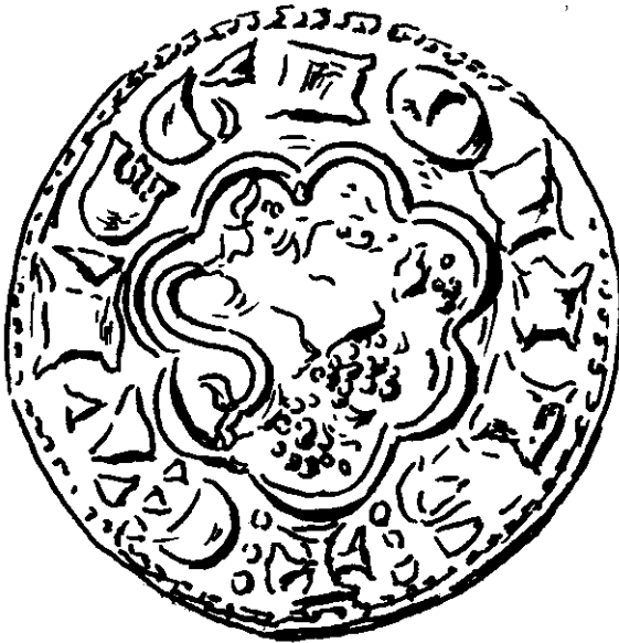
Anverso y reverso de una de las monedas llamadas «novén».