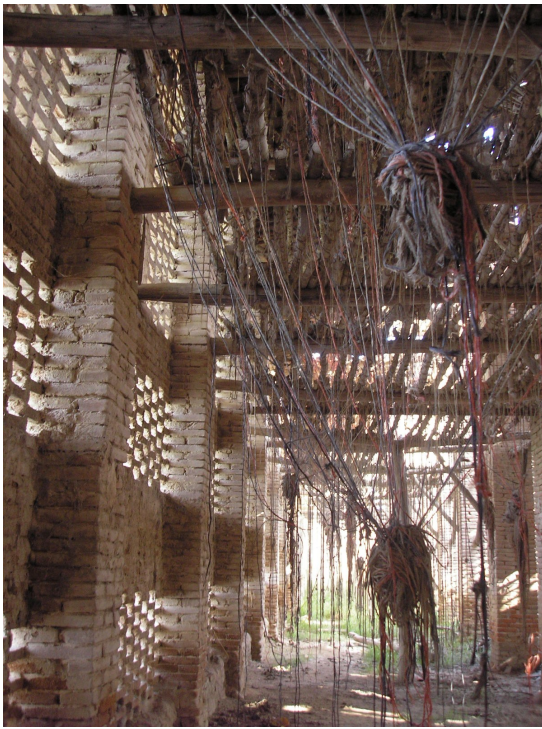
Interior de un secadero