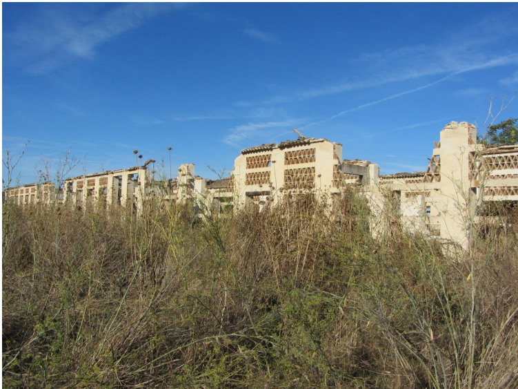
Secadero en Las Herencias