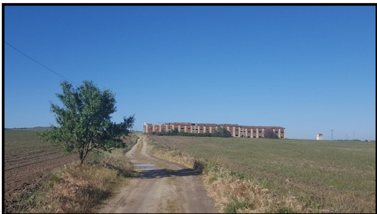
Secadero en Talavera