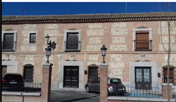
Casas en buen estado