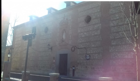
Convento del Espíritu Santo