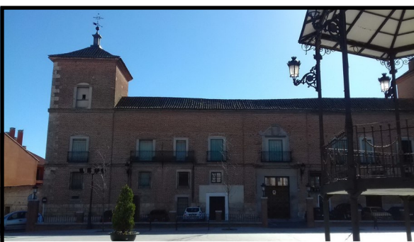
Casa-Palacio de los Condes